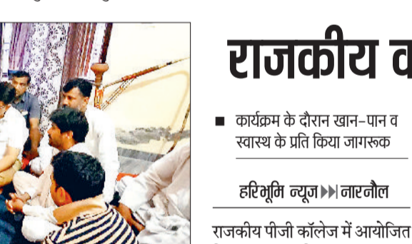
मौहल्ला महायज्ञान में आबेडकर को किया याद