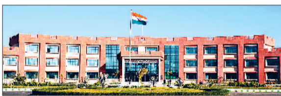
महेन्द्रगढ़। हरियाणा केंद्रीय विश्वविद्यालय का भवन।

हरियाणा केंद्रीय विश्वविद्यालय के शिक्षक शिक्षा विभाग में उपलब्ध चार वर्षीय इंटीग्रेटेड टीचर एजुकेशन प्रोग्राम (आईटीईपी) में दाखिले के इच्छुक आवेदकों के लिए आवेदन प्रक्रिया शुरू हो गई है। विश्वविद्यालय इस पाठ्यक्रम में दाखिले राष्ट्रीय परीक्षा एजेंसी (एनटीईपी) द्वारा आयोजित की जा रहे नेशनल कॉमन एंट्रेंस टेस्ट (एनसीईटी)-2024 के आधार पर करेगा, जिसके लिए ऑनलाइन आवेदन की प्रक्रिया शुरू हो गई है। विश्वविद्यालय के कुलपति प्रो.