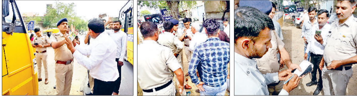
नारनौल। गर्मागर्म बहस करते पुलिस एवं प्राइवेट स्कूल बस संचालक व प्राइवेट स्कूल बस वालों को हिदायत देती पुलिस व काटे गए चालान पर हस्ताक्षर करता स्कूल बस ड्राइवर।

गत 11 अप्रैल को कनिनी खंड के गांव उन्हाणी के पास स्कूल बस दुर्घटनाग्रस्त होने पर करीब चार दिन बाद जिले के प्राइवेट स्कूल खुले। जब यह प्राइवेट स्कूल खुले तो दोपहर को करीब दो-छाई बजे बसों को चेक करने के लिए मुस्तेद थीं। नारनौल शहर में रेवाड़ी रोड पर दोपहर के समय स्कूलों की छुट्टी होने पर बच्चों को लेकर आ रही बसों को ताबड़तोड़ चेक करने लगे। इससे इस अति व्यस्त मार्ग पर देखते ही देखते तुरंत ही रोड जाम लग गया। सड़क पर स्कूल बसें ही बसें नजर आ रही थीं और इनके बीच अन्य वाहन भी फंस गए। इस दौरान बस संचालकों एवं पुलिस वालों की बीच काफी गर्मागर्म बहस एवं तकरार भी देखने को मिली, लेकिन पुलिस के तैवरों के सामने बस वालों की एक न चली। पुलिस काफी सख्त मूड में थी। बता दें कि गत 11 अप्रैल को प्रातः करीब साढ़े आठ बजे बच्चों को लेकर जीएल स्कूल कनिनी की तरफ जा रही थी तो उन्हाणी के पास चालक बस पर से नियंत्रण खो बैठा और वह ओवरस्पीड में पेड़ों से टकराकर पलट गई, जिसमें छह बच्चों की दर्दनाक मौत हो गई, जबकि लगभग दो दर्जन बच्चों को गंभीर