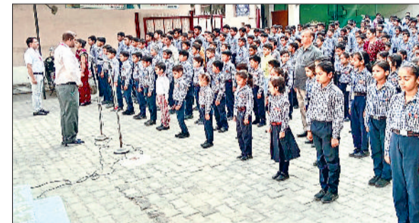
नारनौल। सरस्वती स्कूल में दिवंगत बच्चों को श्रद्धांजलि देते विद्यार्थी।