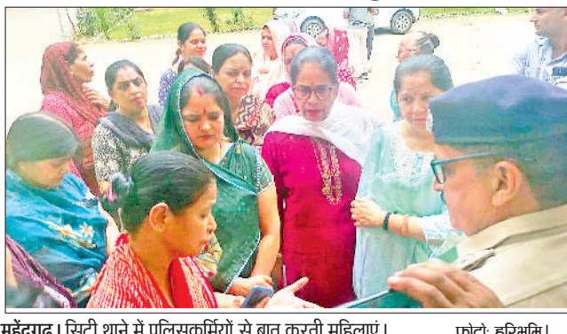
महेन्द्रगढ़। सिटी थाने में पुलिसकर्मियों से बात करती महिलाएं।